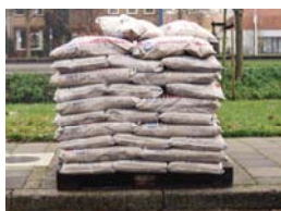
In verband gestapeld